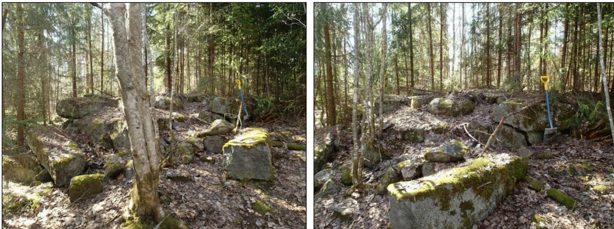
Kivirakennelma - mahdollinen lastaussilla tms. jäännökset tai puretun rakennuksen jäämistöä. Kuvattu luoteeseen (vas.) ja koilliseen (oik.).

N 6817810 E 312845 Z 88. Kaakkoon viettävässä rinteessä on pääosin kookkaista ja muotoilluista rakennuskivistä tehty suoraseinämäinen, laeltaan tasainen kiviperustus. Kooltaan se on noin 3,5 x 3 m, korkeudeltaan max. noin 130 cm. Tästä lähtee ylärinteen puolelle muutaman metrin pituinen maasta tehty tasapohjainen rakenne - "lastaussilta". Kivirakenteen ympäristössä on lisäksi muutamia tiiliä. Aivan ilmeisesti kyseessä on joko latoon tms. ulkorakennukseen liittyvä lastauslaituri. Rakenteen raunio ilmeisesti liittyy v. 1954 ja 1961 kartoille merkittyyn ristin muotoiseen ulkorakennukseen, joka on sijainnut heti kiviraunion eteläpuolella.