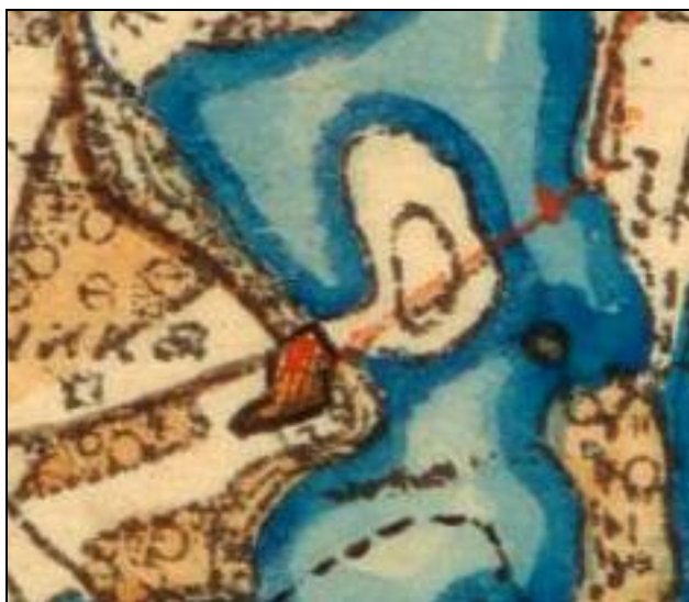
Ote Senaatinkartasta v. 1909.