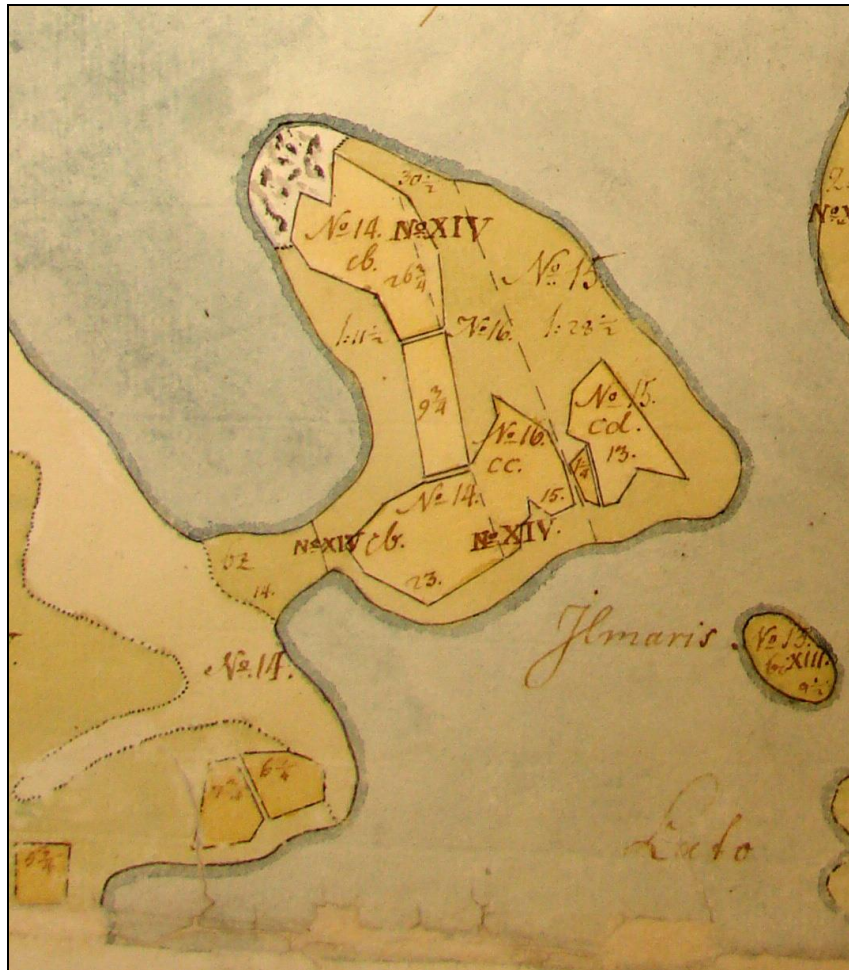
Ote kartasta v. 1769. Viinikanniemen alueella on peltolohkoja ja niittyä.