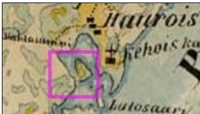
Ote kihlakunnankartasta v. 1878. Viinikan taloa ei siihen ole merkitty.