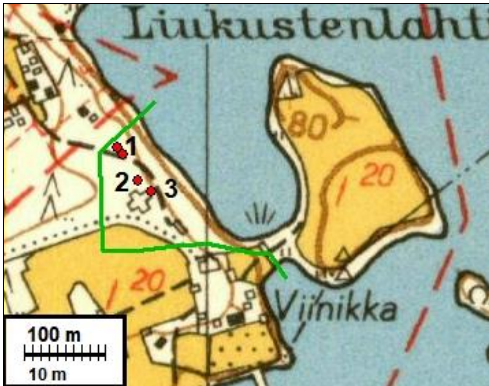
Ote peruskartasta v. 1954. Päälle on piirretty punaisin palloin havaitut kuopat ja rakenteiden jäännökset, sekä vihreällä tutkimusalueen raja.