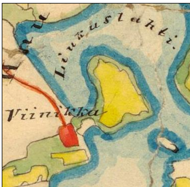
Ote Pirkkalan pitäjänkartasta v. 1847. Tällä kohden siihen on tehty päälle piirros 1800-luvun lopulla. Ensimmäinen kartta (1800-l lopulla) johon Viinikan talo on merkitty. Niemi on kokonaan peltona ja tutkimusalueen pohjoispuoli metsää.