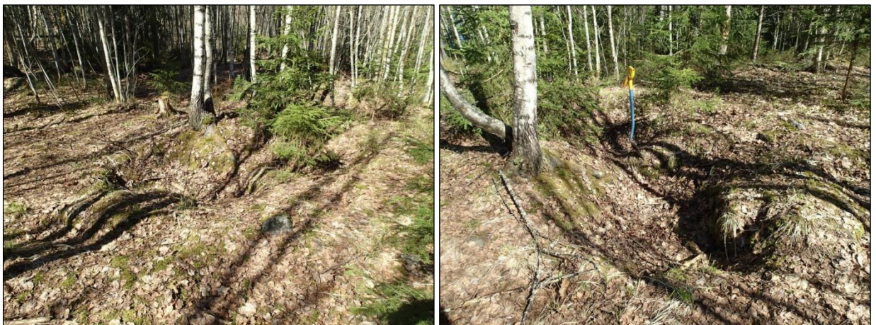
Luoteisempi kellarikuoppa. Kuvattu pohjoiseen (vas). Luoteisempi kellarikuoppa. Kuvattu itään (oik).

N 6817843 E: 312828 Z: 88. Rinteen tasaisen osan ja kaakkoon jyrkemmin viettävän osan taitekohdan tienoilla on kaksi soikeaa maakuoppaa noin 10 metrin etäisyydellä toisistaan. Kaakkoisempi on kooltaan noin 2 x 3 m, syvyydeltään puolisen metriä. Luoteisempi (N 6817851 E 312821 Z 89) on kooltaan noin 3,5 x 2 m, syvyydeltään noin 60 cm. Sen pohjalla on muutaman kymmenen sentin korkuinen maavalli, joten se hahmottuu kaksiosaisena. Ei podsolia. Ilmeisesti kyseessä ovat varsin myöhäiset (eli nykyaikaiset), mahdollisesti kellarikuoppien jäänteet.