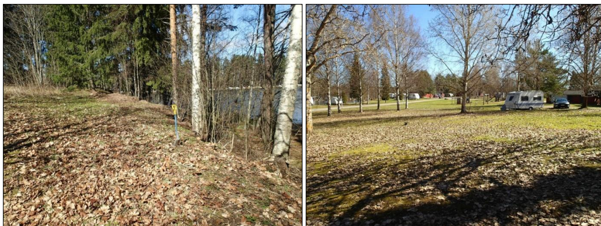
Yleiskuva alueen pohjoisosasta. Kuvattu pohjoiseen (vas.). Yleiskuva alueen pohjoisosasta etelään (oik.).