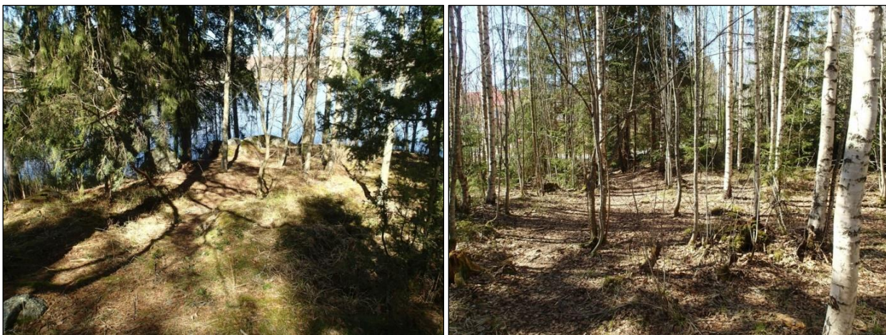
Yleiskuva. Alueen pohjoisosan kallion laki. Kuvattu koilliseen (vas.). Yleiskuva alueen länsilaidalta. Kuvattu pohjoiseen (oik.).